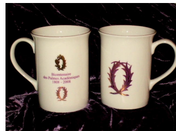
Maxi-tasse vue de front et de dos

Vous me permettrez de profiter de cette lettre pour vous souhaiter, à toutes et tous, et avec quelques semaines d'avance, d'excellentes fêtes de fin d'année. Dans l'attente de vous revoir prochainement lors de notre Assemblée Générale, je vous prie de croire en mes sentiments amopaliens les plus cordiaux.